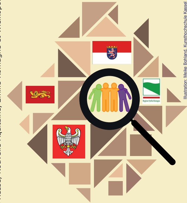
Illustration: Meike Bohland, Kunsthochschule Kassel

Concours en Hesse, Nouvelle-Aquitaine, Emilie-Romagne et Wielkopolska